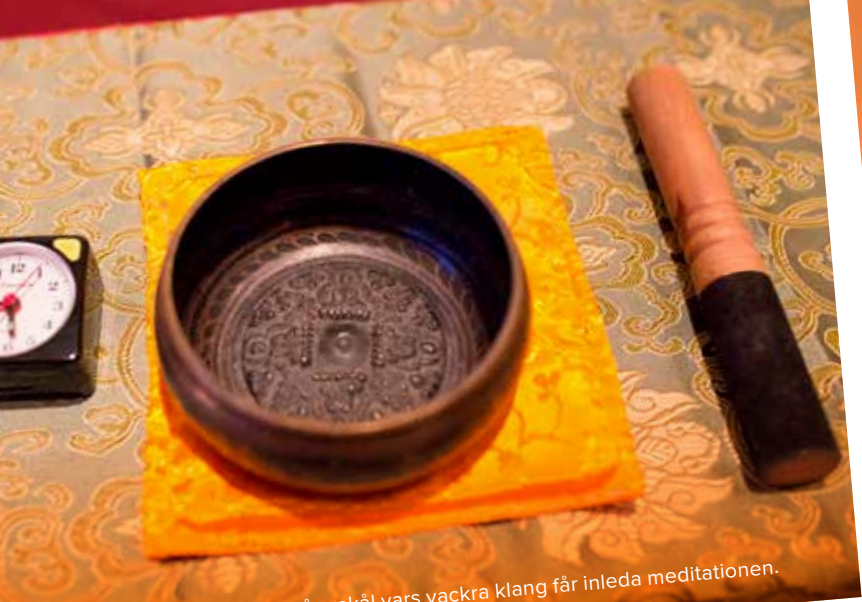
Hjälpmedel. En tibetansk sångskål vars vackra klang får inleda meditationen.