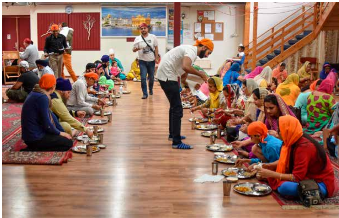
Måltiden. Köket är viktigt i ett sikhiskt tempel. Måltiden, langar, är en del av gudstjänsten. Köksansvaret cirkulerar.

I gudstjänstrummet, diwanhallen, samlas fler och fler människor. De flesta kommer familjevis, bugar sig djupt inför himmelsängen där Guru Granth Sahib ligger och slår sig sedan ner på golvet. Trots den höga ljudnivån och en del skuttiga fötter hos barnen, är stämningen meditativ. En del sitter med slutna ögon, många sjunger med när musikerna, ragis, spelar, sjunger och reciterar ur Guru Granth Sahib. Musiken kallas kirtan. Ljudet är rytmiskt och repetitivt. Rösterna avlöser varandra men det finns inget program