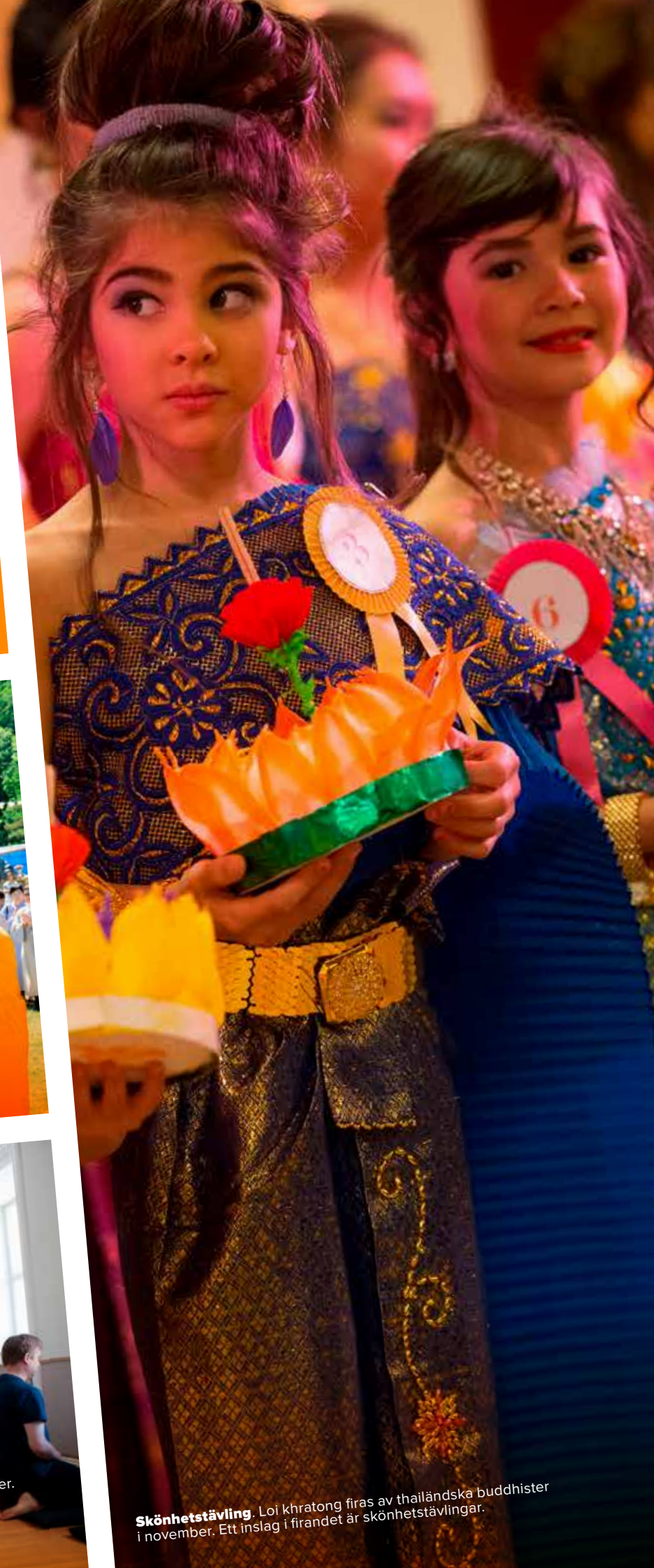
Skönhetstävling. Loi khratong firas av thailändska buddhister i november. Ett inslag i firandet är skönhetstävlingar.