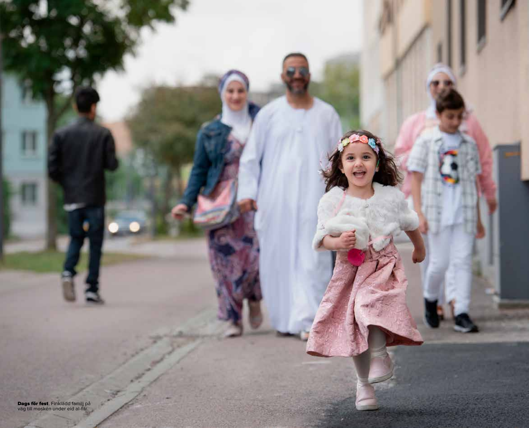
Dags för fest. Finkladd familj på väg till moskén under eid al-fitr.