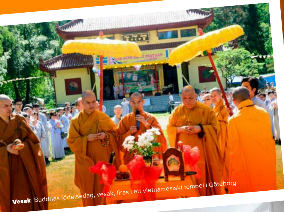
Vesak. Buddhas födelsedag, vesak, firas i ett vietnamesiskt tempel i Göteborg.